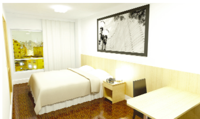
Apartamentos confortáveis e funcionais

O 155 Hotel também dispõe de duas salas para pequenos e médios eventos e de salão para o café da manhã.